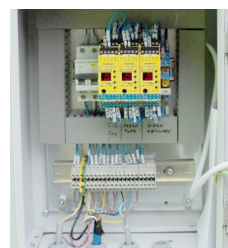
Tablou protecție CGA