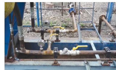
Supapă generală de sens și robinete izolare