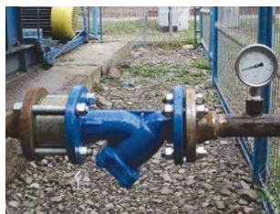
Filtru Y aspirație